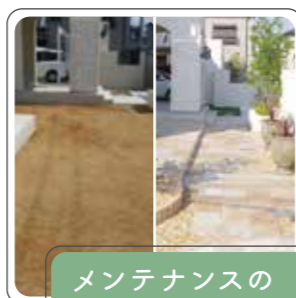
メンテナンスの負担軽減

フェンスや植栽にて人の視線を遮ることで、プライバシーを確保できる他、門扉や塀で囲うと防犯性の向上が狙えます。