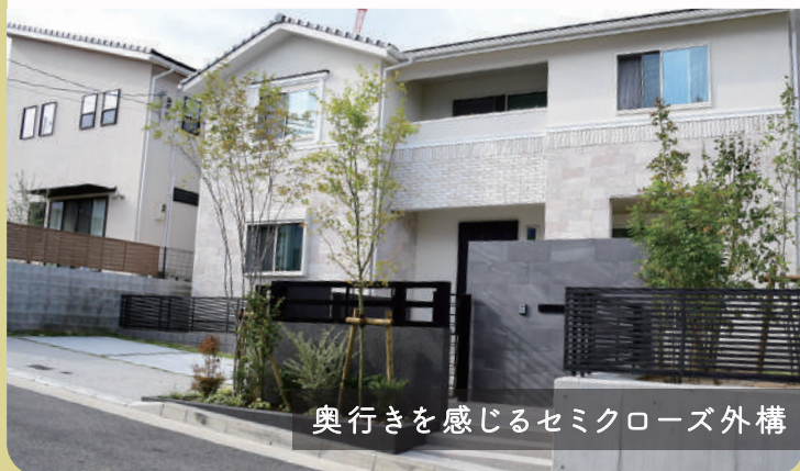
奥行きを感じるセミクローズ外構