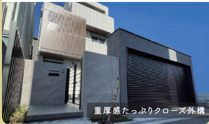
重厚感たっぷりクローズ外構