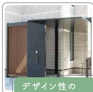
デザイン性の向上

外構によってお家の印象は大きく左右します。目的に合わせて商品やその素材、色選びを行うと、あなただけの素敵な空間づくりに繋がります。