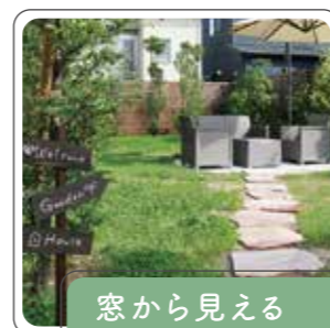
窓から見える「景色」づくり

外構工事を施さない箇所はむき出しの土状態。防草シートでの雑草対策の他、乾燥を好む植物でドライガーデンを作ると手間が軽減します。