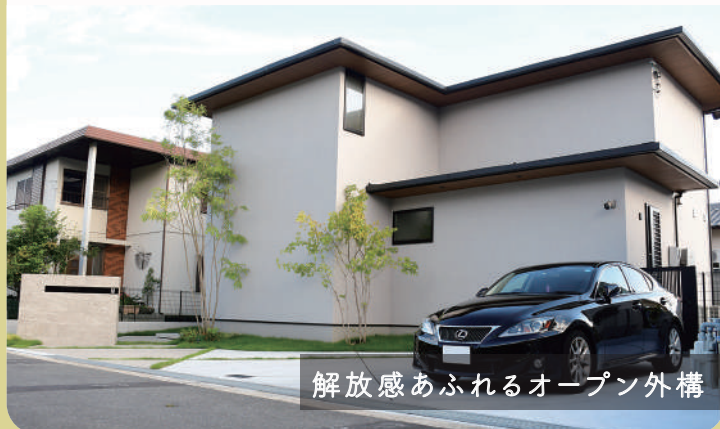
解放感あふれるオープン外構