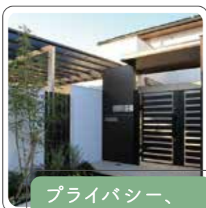
プライバシー、防犯面強化

外構によってお家の印象は大きく左右します。目的に合わせて商品やその素材、色選びを行うと、あなただけの素敵な空間づくりに繋がります。