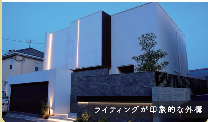
ライティングが印象的な外構